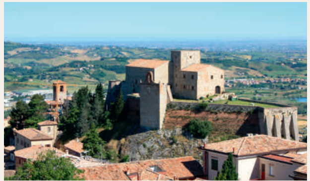
Rocca del Sasso di Verucchio