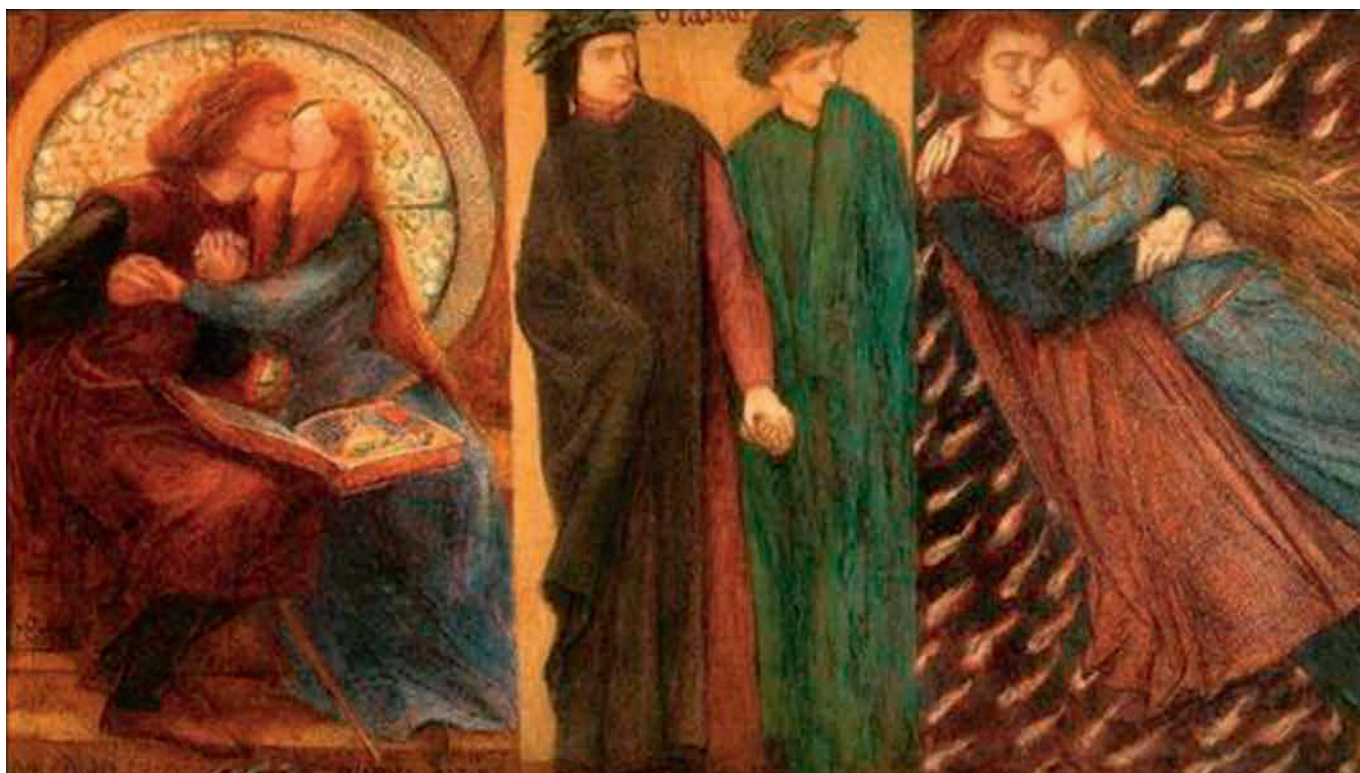
Londra, Tate Gallery: Paolo e Francesca da Rimini , Dante Gabriel Rossetti, Acquerello su carta (1855)

È stato possibile delineare con maggiore nitidezza la figura storica di Paolo ed è stata individuata la famiglia di Francesca che ha rivelato "un mondo" e uno scenario inesplorato e sorprendente permettendo di ridisegnare il rapporto tra Dante e gli innamorati, soprattutto con Francesca, precisando il movente della tragedia e la sua ambientazione.