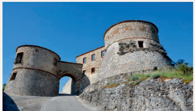
Rocca di Scorticata