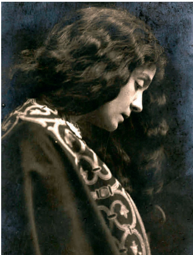
Roma, Teatro Costanzi: Eleonora Duse al debutto della Francesca da Rimini di D'Annunzio il 9 dicembre 1901