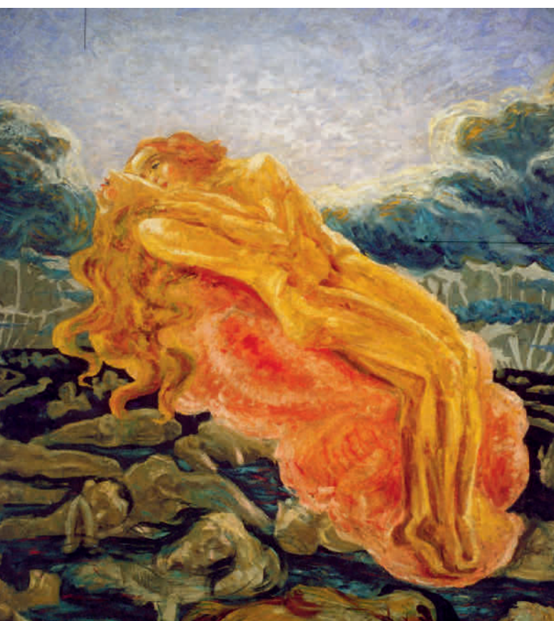
Il sogno, o Paolo e Francesca

Ferrara, Galleria Civica d'Arte Moderna olio su tela, Umberto Boccioni (1909)