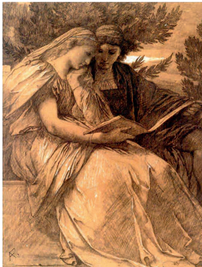
Monaco, Graphische Sammlungen: Paolo e Francesca , gesso nero su carta bruna, Anselm Feuerbach (1858-1863)

Nella narrazione degli eterni amanti si coglie il tema del mito legato a Eros e Thanatos che caratterizza quelle liaisons dangereuses nelle quali mutano i protagonisti, le situazioni, perfino le tipologie delle vittime, ma non l'archetipo delittuoso del dualismo «amore e morte» che domina e suscita incessantemente un'attenzione profonda per la distorsione che le due parole, unite, provocano.