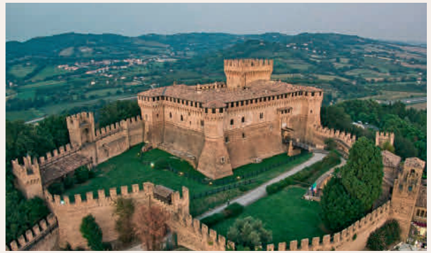
Rocca di Gradara

Coinvolgimento del Liceo Scientifico e Artistico Statale "A. Serpieri" di Rimini relativamente ai programmi scolastici nelle materie di storia, letteratura, storia dell'arte, disegno, grafica, pittura, scultura, architettura, ambiente e paesaggio. Realizzazione di una mostra di disegni, pitture, sculture, grafici, ricostruzioni, plastici e di un volume-catalogo.