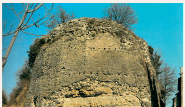
Rocca di Giaggiolo