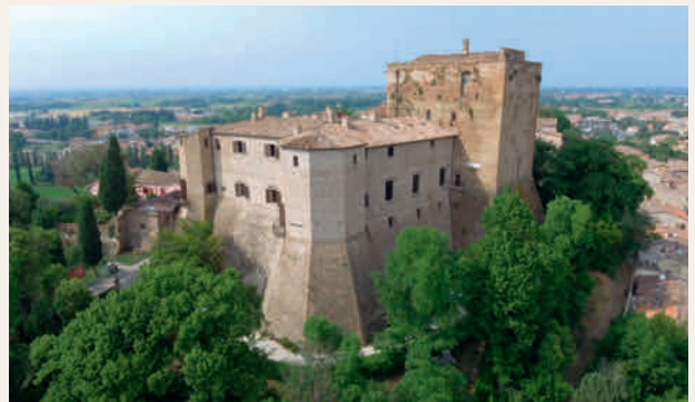
Rocca di Santarcangelo di Romagna