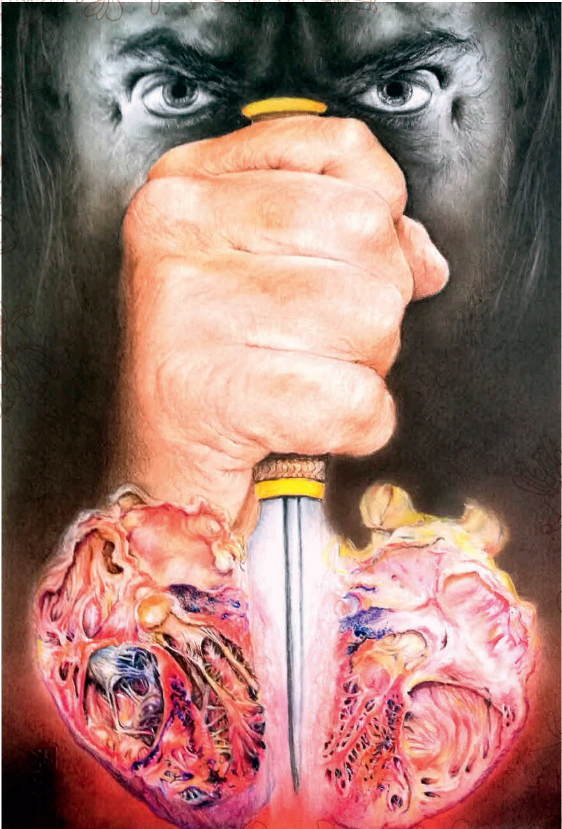
Paolo e Francesca. Anatomia di un crimine, Salvatore Gennaro